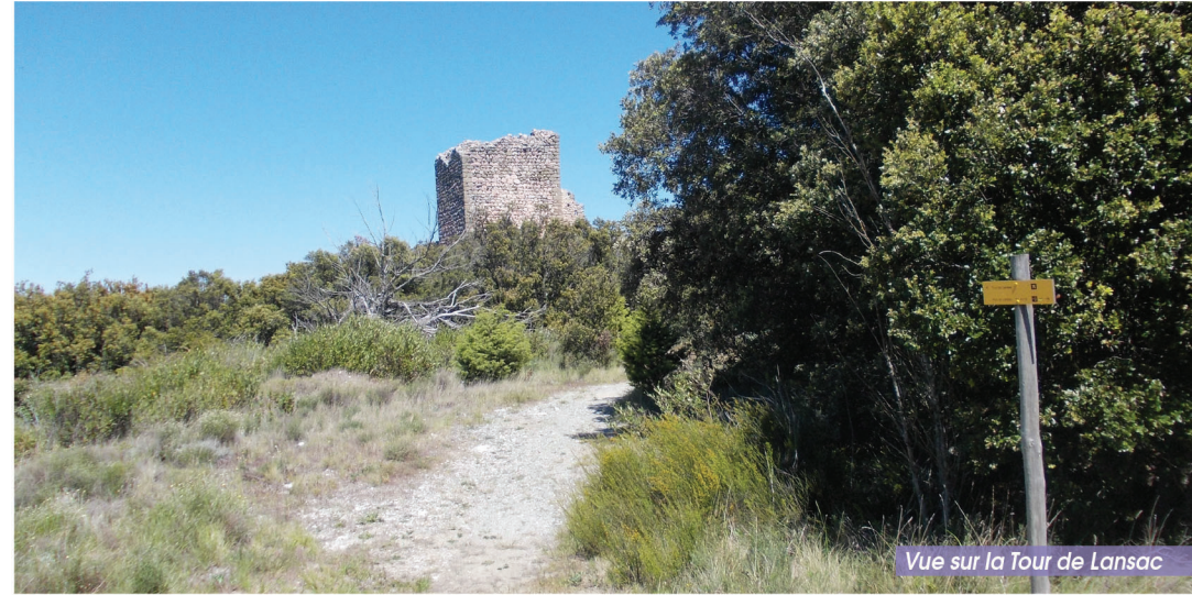
Vue sur la Tour de Lansac