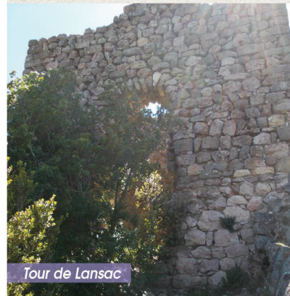
Tour de Lansac