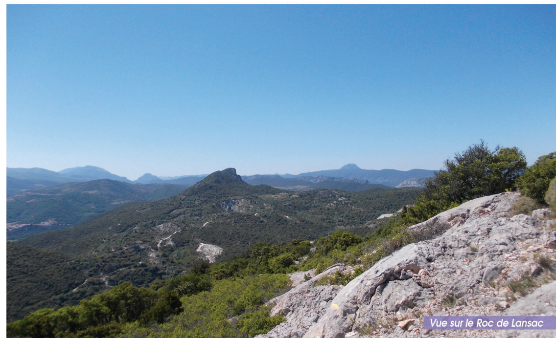
Vue sur le Roc de Lansac