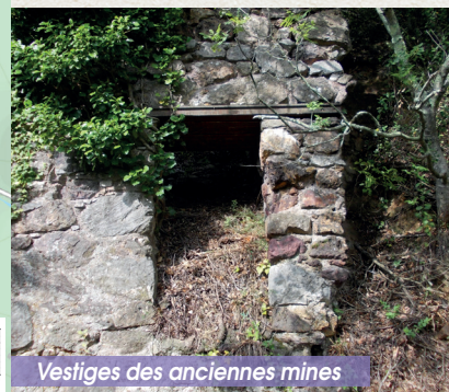
Vestiges des anciennes mines