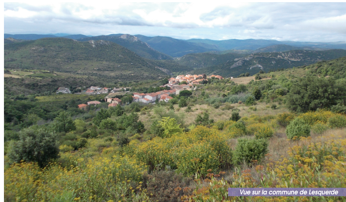
Vue sur la commune de Lesquerde