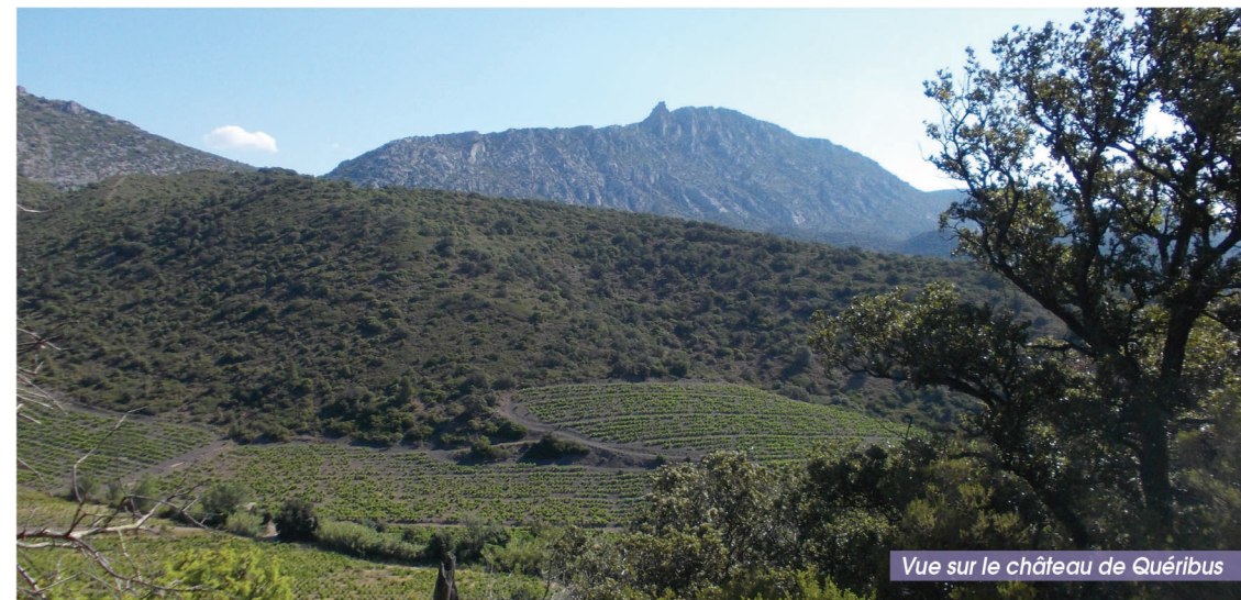
Vue sur le château de Quéribus