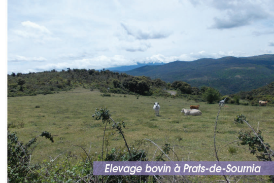
Elevage bovin à Prats-de-Sournia

6 Délaissier à droite le sentier rouge et blanc, puis un chemin, et continuer sur la route. Passer au pied de la butte d'al Carmell (table d'orientation), descendre par des virages. Au croisement continuer en face en direction de la tour de Prats, passer devant un oratoire. Délaissier la route de droite et retrouver le point 1. Revenir au point de départ par le même itinéraire.