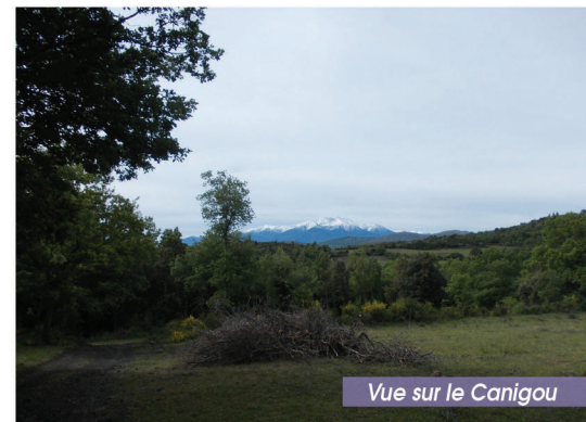
Vue sur le Canigou